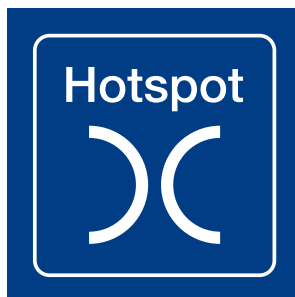
Pictogramme de Hotspot