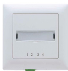
OTO – prise optique de télécommunication (Optical Telecommunications Outlet)