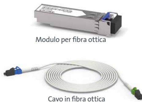
Modulo per fibra ottica