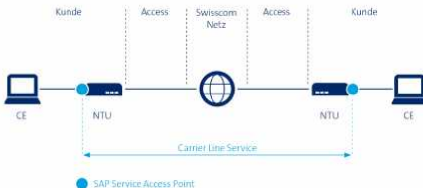
Abbildung 1: Grafische Darstellung eines Carrier Line Service