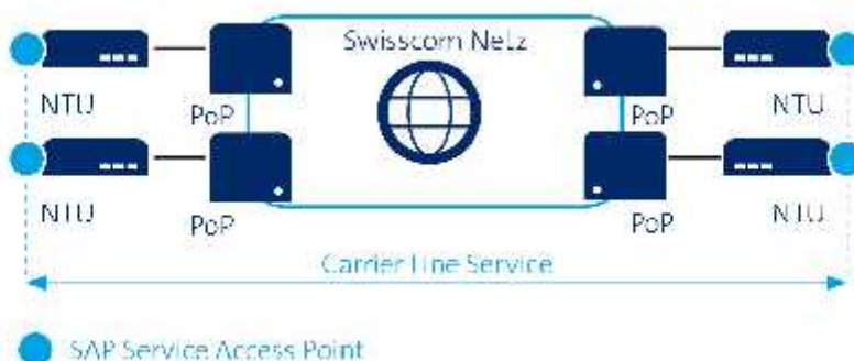
Abbildung 3: Grafische Darstellung eines Carrier Line Service Premium Platinum