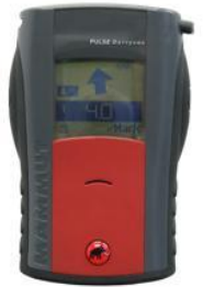
DVA: Type PULSEBarryvox