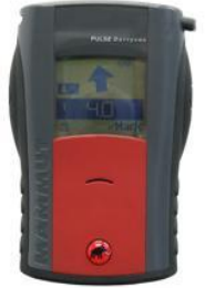
Apparecchio ARVA: Tipo PULSEBarryvox