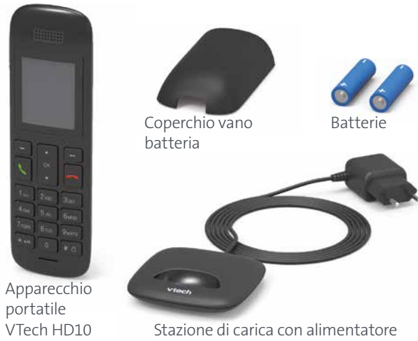
Apparecchio portatile VTech HD10