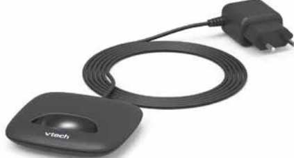
Ladestation mit Netzteil