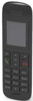
VTech HD10 Handapparat